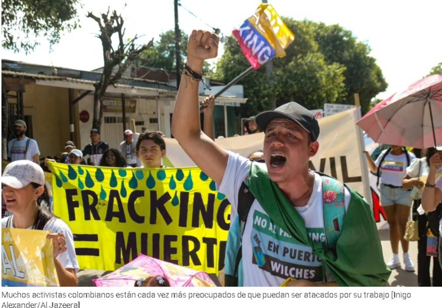
Muchos activistas colombianos están cada vez más preocupados de que puedan ser atacados por su trabajo

Creciente número de amenazas de muerte de grupos paramilitares contra defensores ambientales que se oponen al fracking en Colombia.