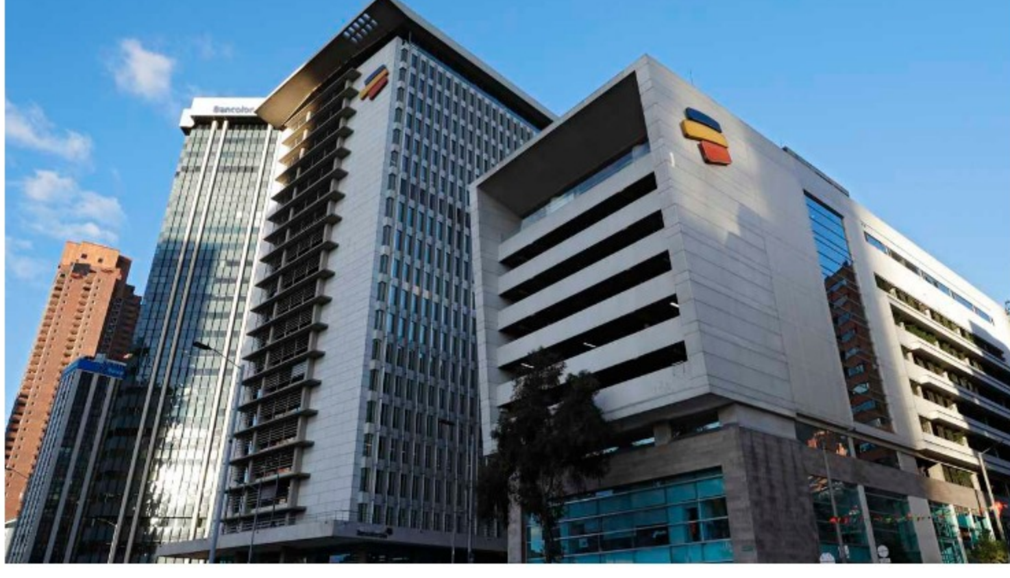
El segundo lugar del ranking lo ocupó Bancolombia, que cuenta con aproximadamente 21.630 empleados en Colombia.

Sobre Coca-Cola Femsa, LinkedIn destacó que cuenta con iniciativas para la inclusión de género, como un piloto centrado en el talento femenino de sus equipos comerciales. También lanzó junto a la entidad Finsocial la línea de crédito Finso Tienda, que ofrece préstamos de $1 millón promedio a emprendedores tenderos.