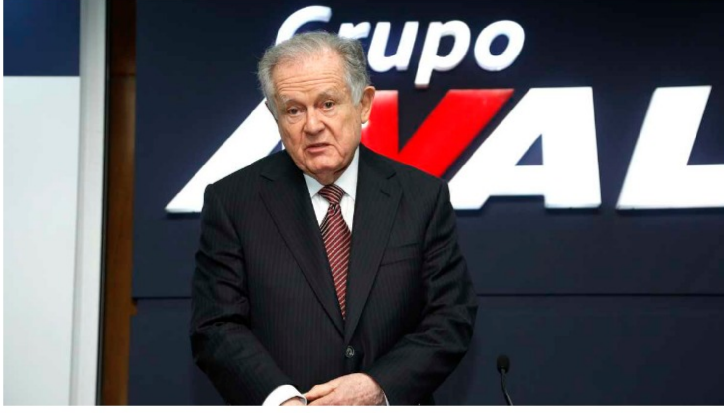
El ranking lo encabeza Grupo Aval, que en 2021 promocionó al 3,7 % de sus empleados por resultados y desempeño.

LinkedIn destacó que en 2021 Grupo Aval promocionó al 3,7 % de sus empleados por resultados y desempeño, y el 80 % de esos ascensos fue de mujeres. Además, el 95,4 % de los empleados participó de procesos de formación y capacitación, en los que la compañía invirtió $1,58 millones por colaborador, en promedio.