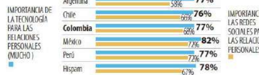
Gráfico: LR&G