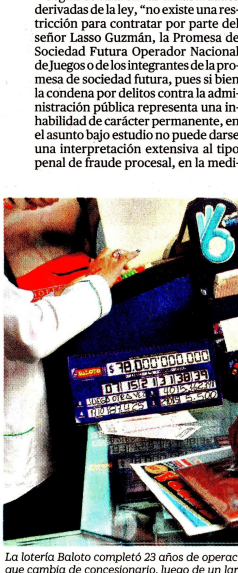
La lotería Baloto completó 23 años de operaciones en Colombia, y esta es la primera vez que cambia de concesionario, luego de un largo proceso de selección que culminó ayer.