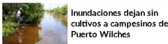
Inundaciones dejan sin cultivos a campesinos de Puerto Wilches

Lea Aquí: Película colombiana "Memoria", entre las grandes ganadoras de los Premios Platino