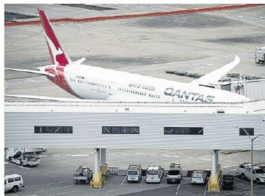
La aerolínea detalló que las inversiones en tecnología fueron pensadas en tener tres categorías de viajero por la duración del vuelo.

Los planes para los servicios sin precedentes han estado en marcha desde al menos 2018. A principios de ese año, Joyce diseñó a Boeing Co. y Airbus a idear un avión que pudiera volar las rutas ultralargas con una carga completa y aun así aterrizar con combustible en la mano para emergencias.