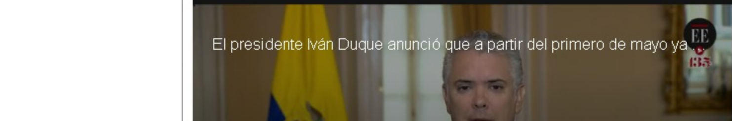
El presidente Iván Duque anunció que a partir del primero de mayo ya

Duque anuncia que ya no será necesario el uso del tapabocas