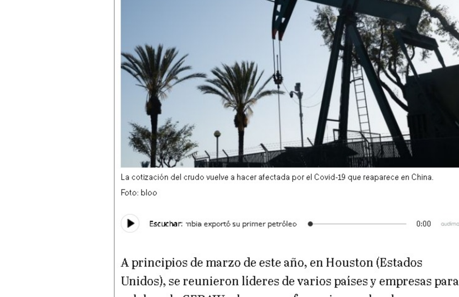
La cotización del crudo vuelve a hacer afectada por el Covid-19 que reaparece en China.