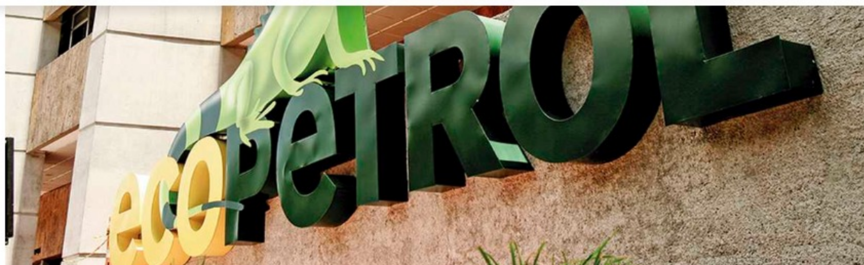
La sanción se debe a la presentación del Informe de Trabajos Posteriores a la Terminación Oficial - Formulario 10CR del Pozo RB 1237H.

Ecopetrol anunció este viernes que fue notificada de la resolución con la que la Agencia Nacional de Hidrocarburos (ANH) informó una sanción por US$4,550, que equivale a cerca de $18,04 millones colombianos.