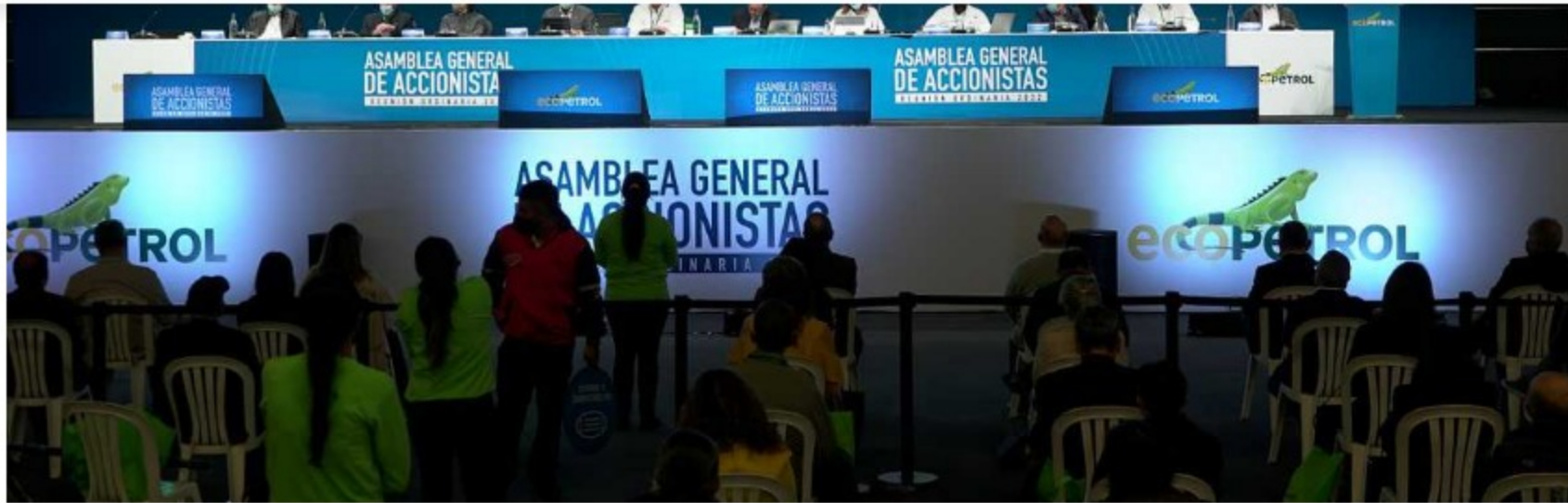
La asamblea aprobó un dividendo ordinario de 243 pesos por acción, y un dividendo extraordinario de 37 pesos por acción.

La Asamblea General de Accionistas de Ecopetrol , que se volvió a realizar de manera presencial luego de dos años de virtualidad por la pandemia de covid-19, aprobó pagar a sus accionistas más de 11,5 billones de pesos en dividendos,