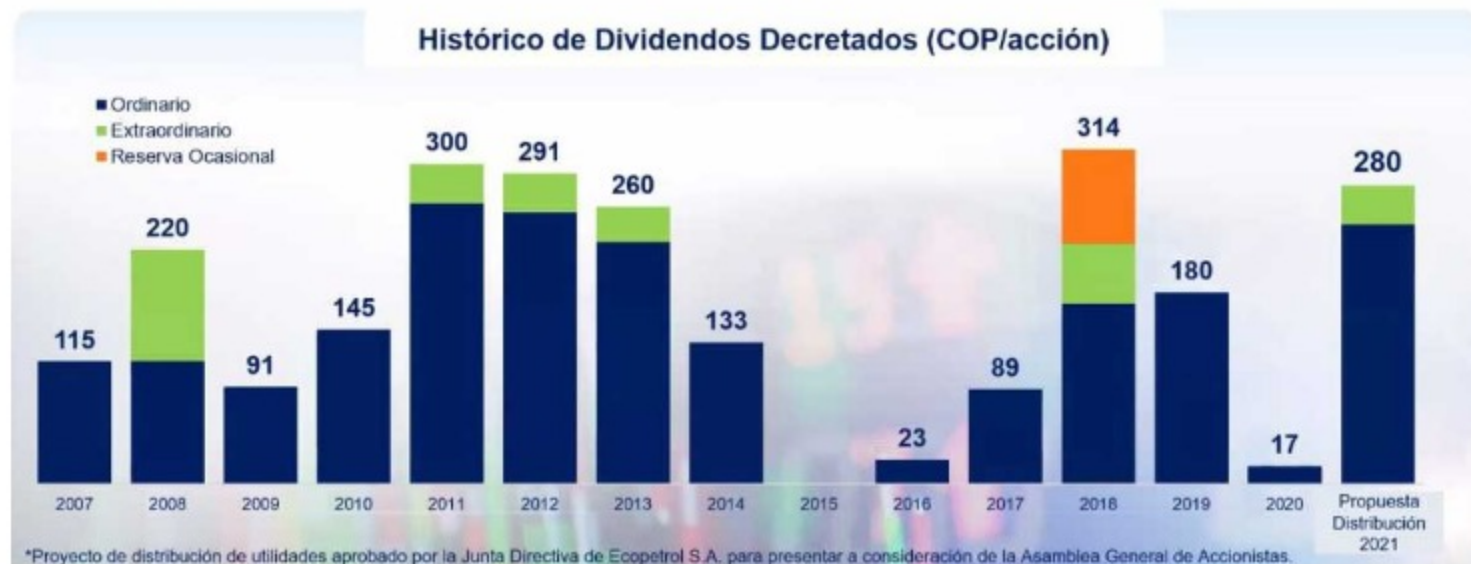
*Proyecto de distribución de utilidades aprobado por la Junta Directiva de Ecopetrol S.A. para presentar a consideración de la Asamblea General de Accionistas.