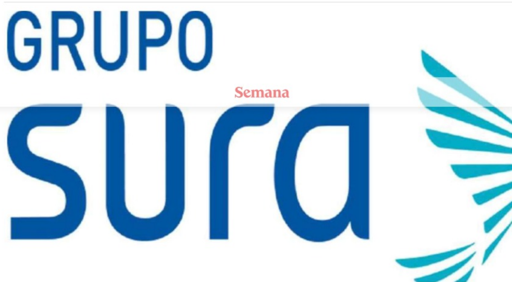
Logo Grupo Sura

Este miércoles se levantó la suspensión de la negociación de la acción del Grupo Sura en la Bolsa de Valores de Colombia y, tras el retorno, el título tiene un incremento en su cotización de 12,68 % en la apertura. Algo similar sucedió con la acción de Nutresa, que se expandía en 6,51 % en las primeras horas de la jornada.