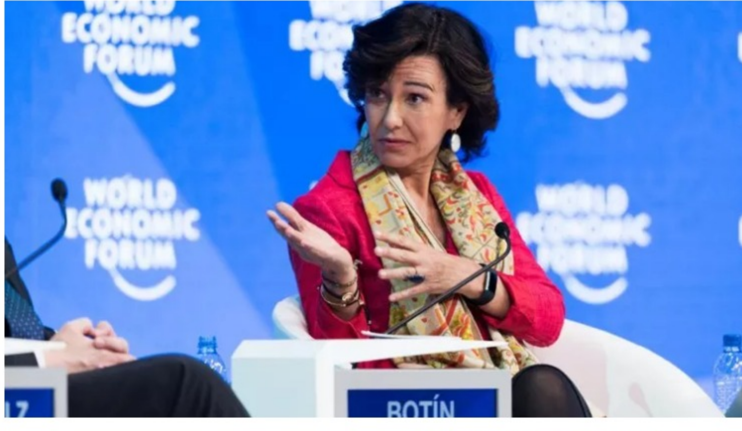
Ana Botín, presidenta del Banco Santander, en el Foro de Davos.