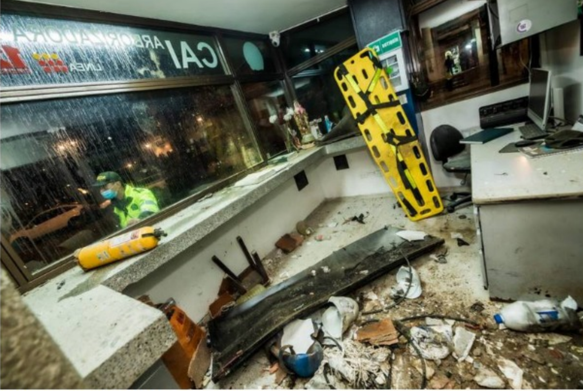
Explosión en CAI en Bogotá Alcaldía de Bogotá

Guerrilleros del Frente 33 de esta estructura armada se atribuyeron el atentado por medio de un video