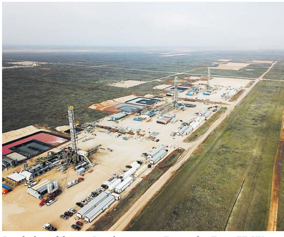
Instalaciones del campo Permian que opera Ecopetrol en Texas, EE. UU.

De acuerdo a la ANLA, en el proceso de evaluación se tuvieron en cuenta los impactos ambientales por el desarrollo de las obras y actividades del proyecto en el área de influencia en los temas bióticos, abióticos y sociales, así como las medidas de manejo y de monitoreo establecidas dentro del Plan de Ma-