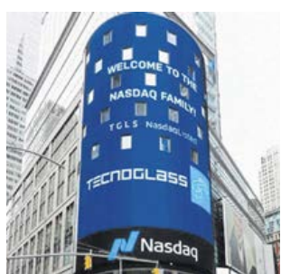
La empresa Tecnoglass.

El título de la compañía barranquillera de cotiza cerca de USD30.