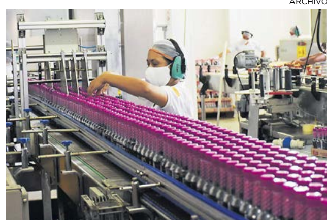
Trabajadores de una empresa de alimentos.

En enero de 2022, el ISE tuvo un crecimiento de 7,8 % en comparación con el mismo periodo del año anterior. Ese resultado es