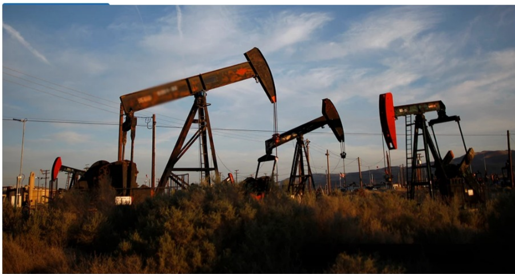
Exploración petrolífera con fracturamiento hidráulico

El abogado del Comité de Santurbán dijo que este piloto, juntos con otros de minería , están planeados para hacerse antes de que termine el periodo del gobierno Iván Duque.