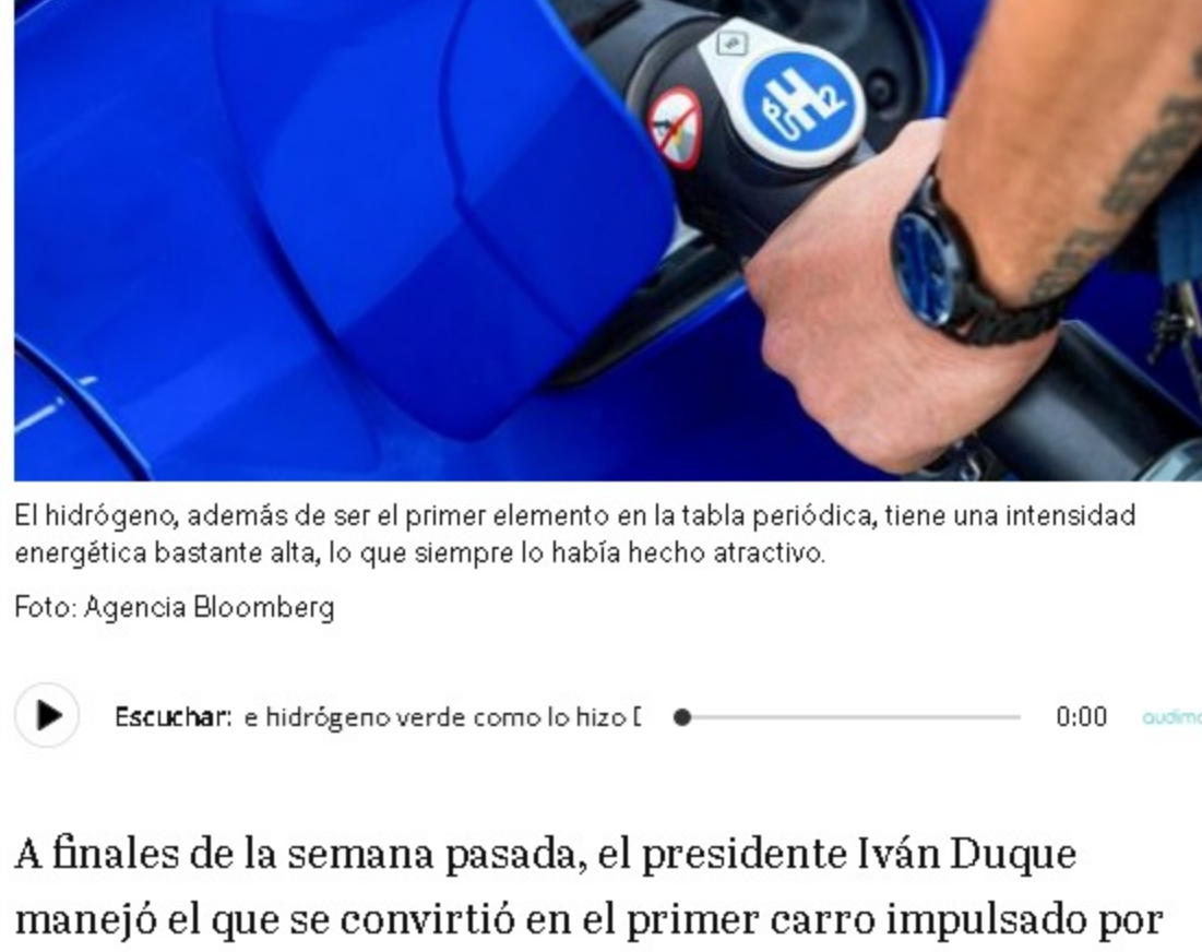
El hidrógeno, además de ser el primer elemento en la tabla periódica, tiene una intensidad energética bastante alta, lo que siempre lo había hecho atractivo.