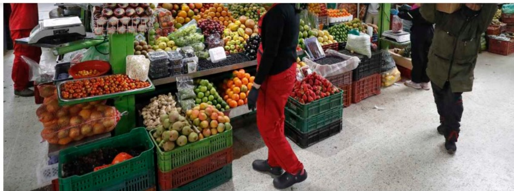
Plaza de Mercado Paloquemao

La Fundación para la Educación Superior y el Desarrollo (Fedesarrollo) reveló este martes los resultados Encuesta de Opinión Financiera e Indicadores de Confianza del mercado de renta variable, en la cual se refleja que los analistas y el mercado son prudentes con las proyecciones económicas para este año en el país y el crecimiento de la inflación.