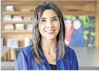
Ministerio de Educación

El Ministerio de Educación, en cabeza de María Victoria Angulo, dio apertura a la plataforma Evaluar para Avanzar 3° a 11°. Con esta, los docentes podrán evaluar de forma online y offline a los estudiantes para hacer un diagnóstico de sus competencias. La cartera afirmó que el reto es llegar a los más de 8.000 establecimientos educativos que aún no han participado en esta plataforma.