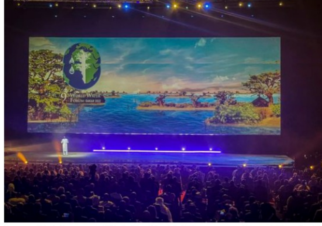
Inauguración de la novena edición del Foro Mundial del Agua que se celebra en Dakar entre 21 y el 26 de marzo de 2022.