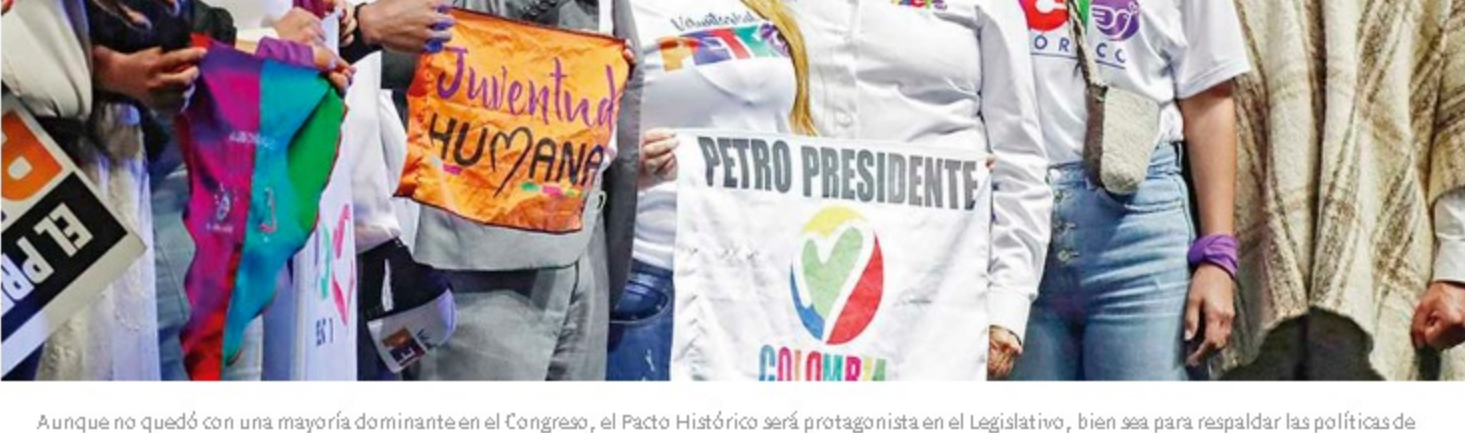
Aunque no quedó con una mayoría dominante en el Congreso, el Pacto Histórico será protagonista en el legislativo, bien sea para respaldar las políticas de Petro, en caso de que sea elegido, o bien para ejercer una oposición férrea si su candidato no gana.

Asimismo, cuenta con una fuerza política sólida, aglutinada en el Pacto Histórico, que dio la sorpresa al obtener el primer lugar en Senado y una gran votación en Cámara. Aunque no tendrán aseguradas las mayorías de manera automática, a nadie le cabe duda de que el Pacto Histórico será un gran protagonista en el próximo Congreso. Si Petro no es el presidente, al que resulte elegido le espera una oposición feroz.