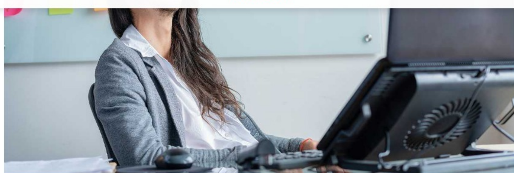
Según la Cámara de Comerciantes LGBT, el poder de compra de esta comunidad en Colombia supera los 16.000 millones de dólares por año.

SEMANA: ¿Cuál es la diferencia de la Cámara de Comerciantes LGBT con el gremio tradicional de comerciantes?