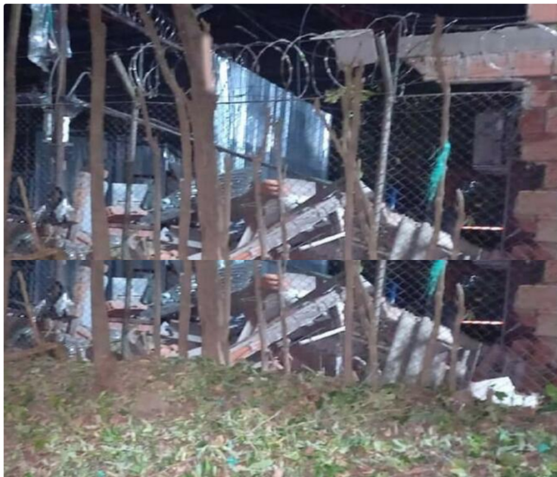
El Verfídico - RCN Radio.

D os días después que el Ejército Nacional anunciara que llegarán más uniformados para reforzar la seguridad de la infraestructura petrolera en Barrancabermeja, se registran dos nuevos atentados.