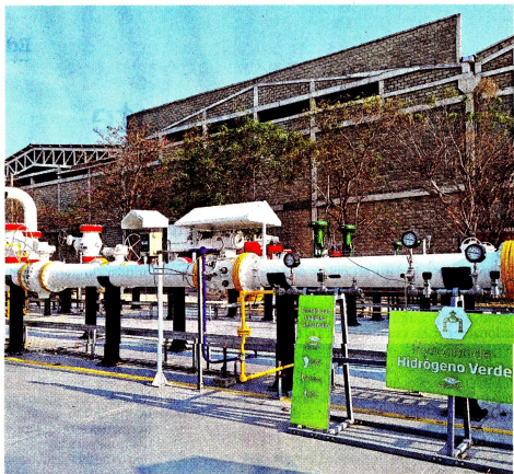
Próximamente se instalará a las redes de gas de Cartagena el hidrógeno que producirá con la energía de la granja de 324 paneles solares, con capacidad de 1.574 kilogramos.

La capital del Bolívar será un centro de investigación, servicios y le apuesta a generar más de 1.000 empleos e inversiones de 2.500 millones de dólares para el 2040.