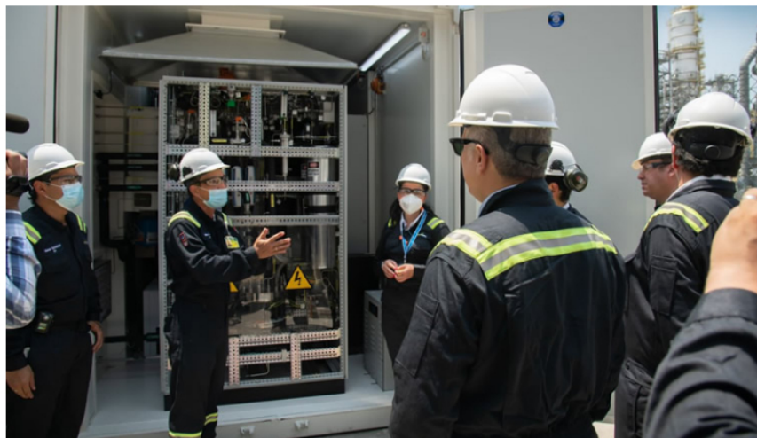
Ecopetrol y Promigas arrancaron primeros pilotos de Hidrógeno Verde en Cartagena

"Hoy lo que estamos viendo y presenciando en Reficar es un hecho histórico en la energía de Colombia. Hoy rueda el primer carro con hidrógeno verde producido por Ecopetrol en la refinería más moderna de América Latina", declaró Duque al manifestar que el hecho más contundente es que el país ratifica que "este 18 de marzo Ecopetrol acaba de instalar este primer electrolizador".