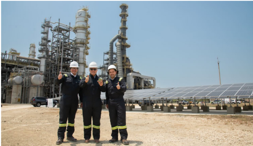
Ecopetrol y Promigas arrancaron primeros pilotos de Hidrógeno Verde en Cartagena

También, que los incentivos existentes para el transporte limpio y sostenible cobijan a los vehículos a base de hidrógeno..