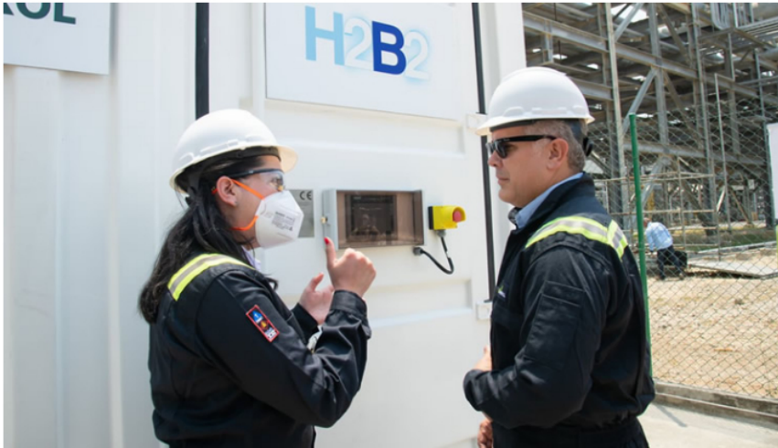
Ecopetrol y Promigas arrancaron primeros pilotos de Hidrógeno Verde en Cartagena

transición energética para 2030 (...) Pero para el año 2030, seremos el mayor exportador de hidrógeno verde en toda América Latina y el Caribe. Y eso se logra con hechos, con propósitos y ese futuro empieza hoy", añadió.