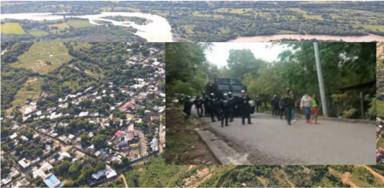
Hato Nuevo, Villavieja-Huila

Los habitantes están exigiendo que una empresa contratista de Ecopetrol contrate a un joven del municipio