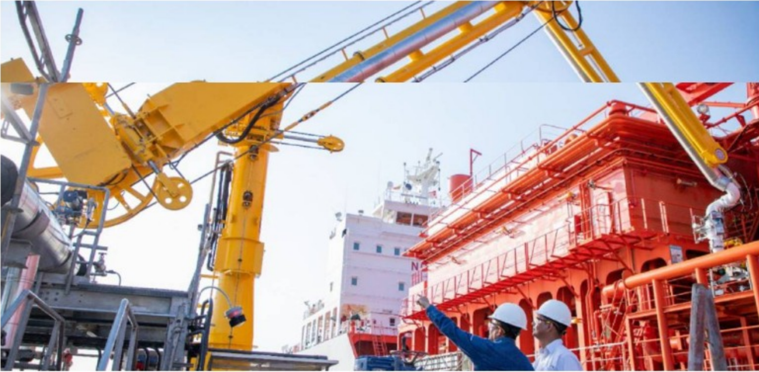
Esenttia / Ecopetrol