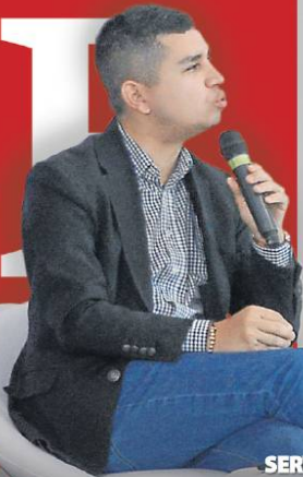
Jonathan Malagón MINISTRO DE VIVIENDA