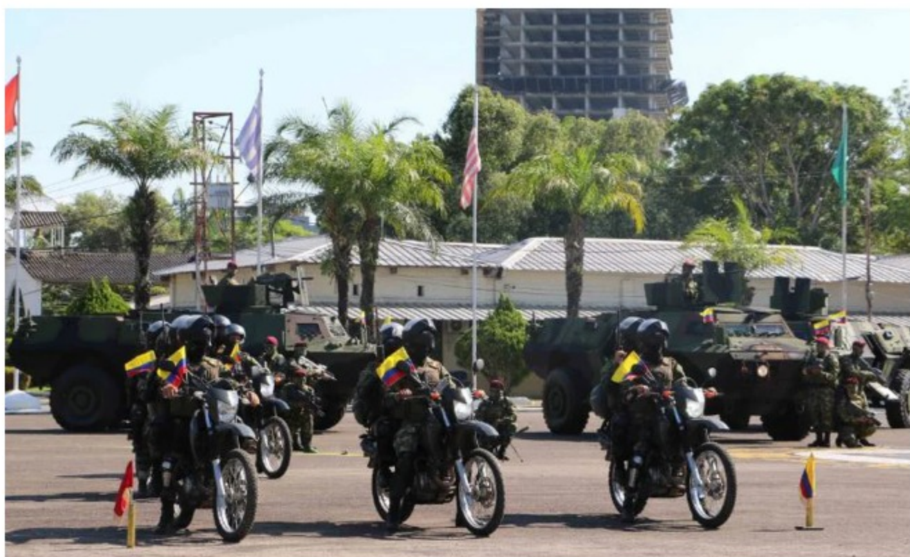
En Barrancabermeja, Ejército Nacional activó el Plan Integral de Seguridad.

El Ejército nacional anunció que 200 soldados llegaron a Barrancabermeja, Santander, para reforzar la seguridad la ciudad. De esta forma, serán más de 2.000 uniformados los que estarán a cargo de la vigilancia del puerto petrolero.