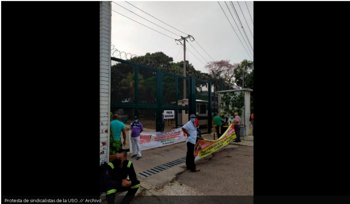
Protesta de sindicalistas de la USO.

La jornada ha causado traumatismos de movilidad en la zona. Ecopetrol se refirió al respecto.