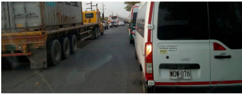
Vía a Mamonal. // Cortesía

Y agregó: "Estamos diciéndole a Ecopetrol que el sistema de salud se respeta porque está acordado en la Convención Colectiva de Trabajo. (...) Si hay que hacer alguna modificación es para avanzar y mejorar. Ojalá el pueblo de Cartagena se uniera. Hoy nos toca pelear a nosotros y vamos a seguir haciéndolo porque no nos pueden menoscabar nuestros derechos".