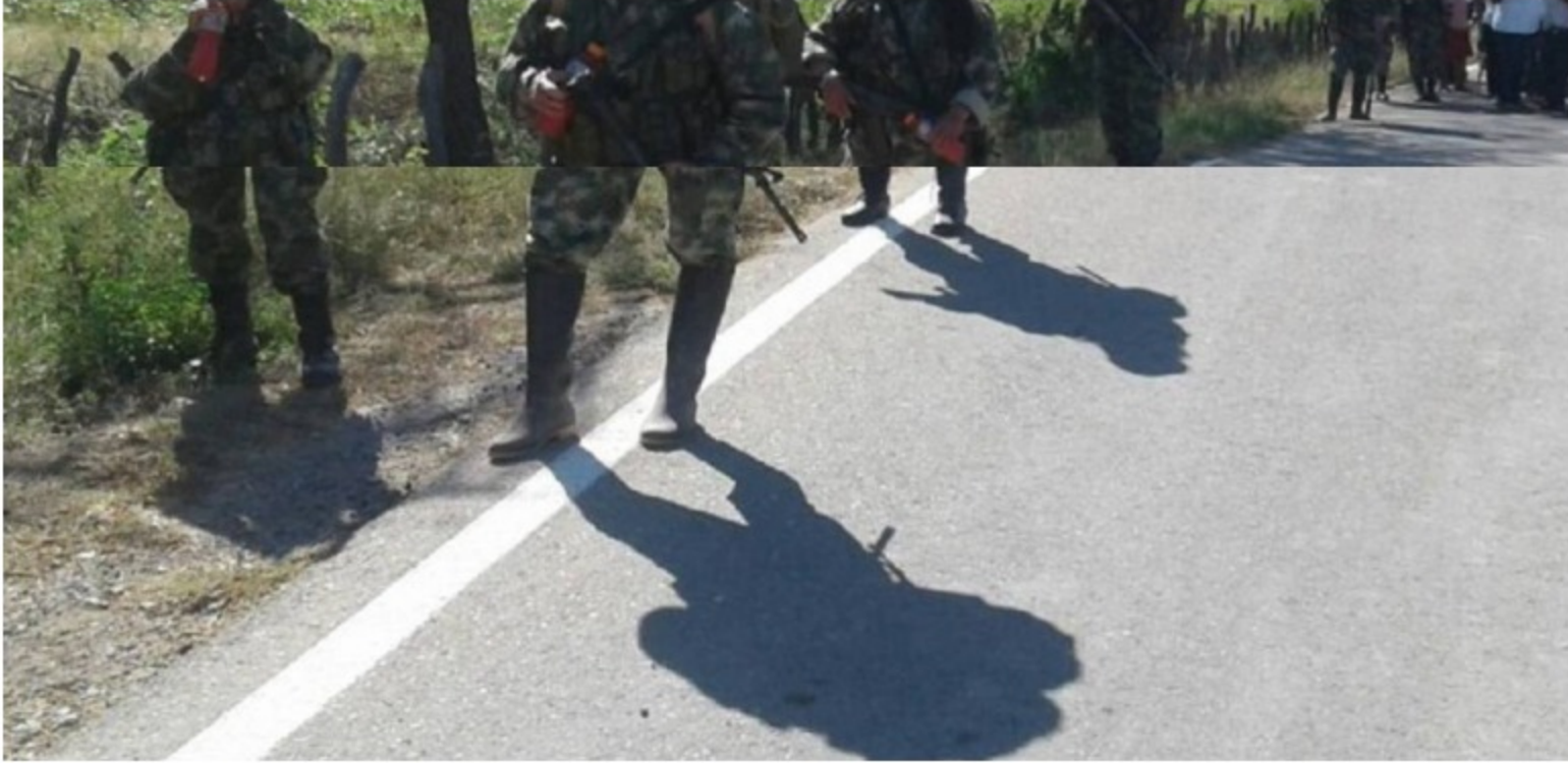
Golpean banda por hurto de hidrocarburos para grupos ilegales en Catatumbo

Los delincuentes negociaban con los grupos al margen de la ley