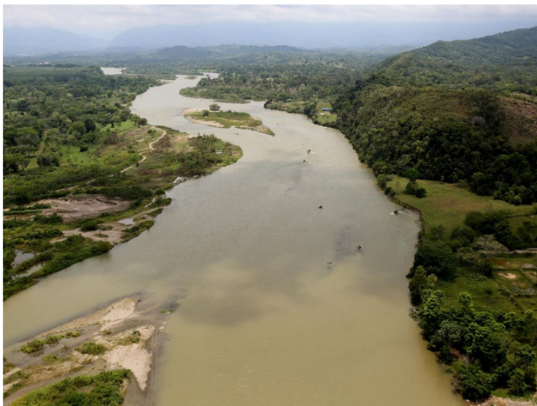
El Río Sogamoso, en La Fortuna cerca a Barranca Bermeja (Colombia). Leonardo Muñoz

Inicia Congreso Internacional Ambiental, innovación sustentable y