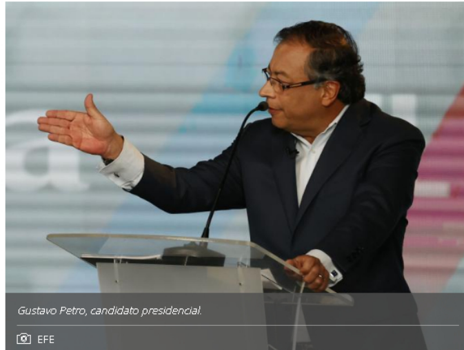
Gustavo Petro, candidato presidencial.