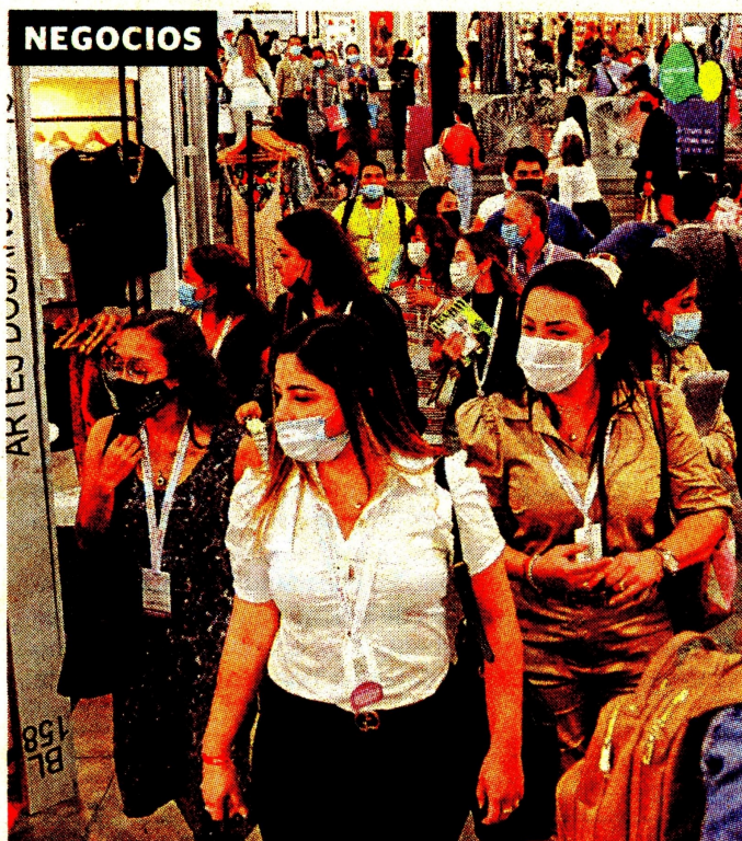
Hoy se celebra el Día del Consumidor, desde hace 60 años.

El Colcap bajó 1,98% y la acción de Ecopetrol se desplomó 5,68%. Por su parte, el dólar cayó $27 y expertos alertan por el riesgo país. Pág. 6