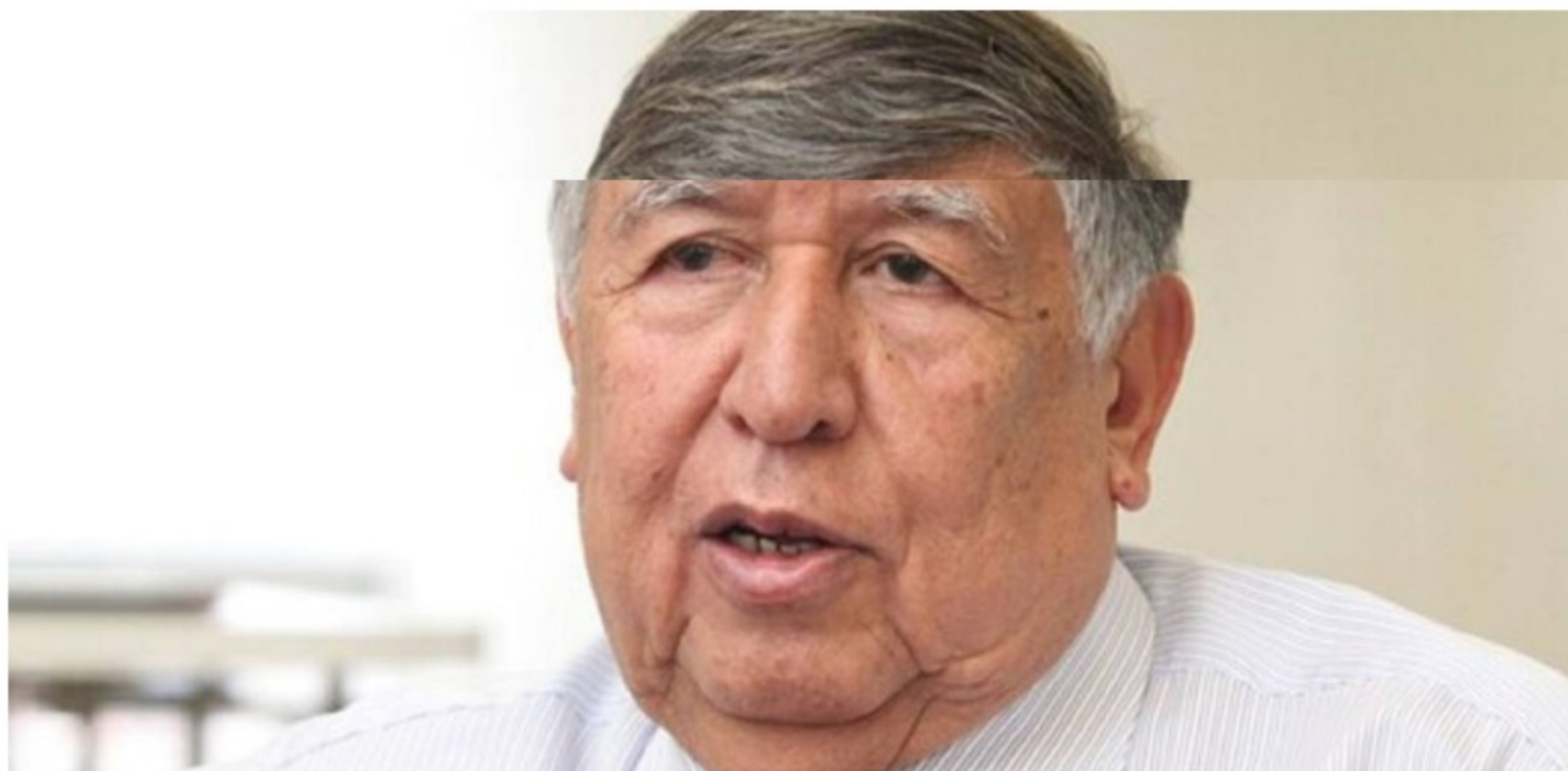
José Noé Ríos / Colprensa

En el 2021 la Cetcoit sesionó en 82 ocasiones en donde trató 24 casos y logró suscribir 17 acuerdos