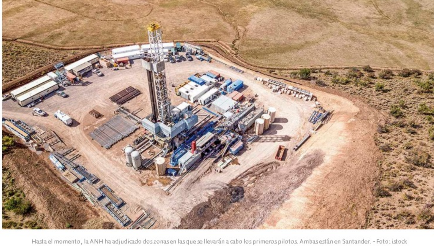
Hasta el momento, la ANH ha adjudicado dos zonas en las que se llevarán a cabo los primeros pilotos. Ambas están en Santander.

Según expresaron, con la acción muestran el inconformismo por el avance con los pilotos, "a pesar de que existe una moratoria judicial en Colombia para hacer fracking comercial desde el 2018 y de que se ha comprometido internacionalmente a reducir sus emisiones de Gases de Efecto Invernadero (GEI) y a implementar estrategias para la mitigación de la crisis climática a nivel interno".