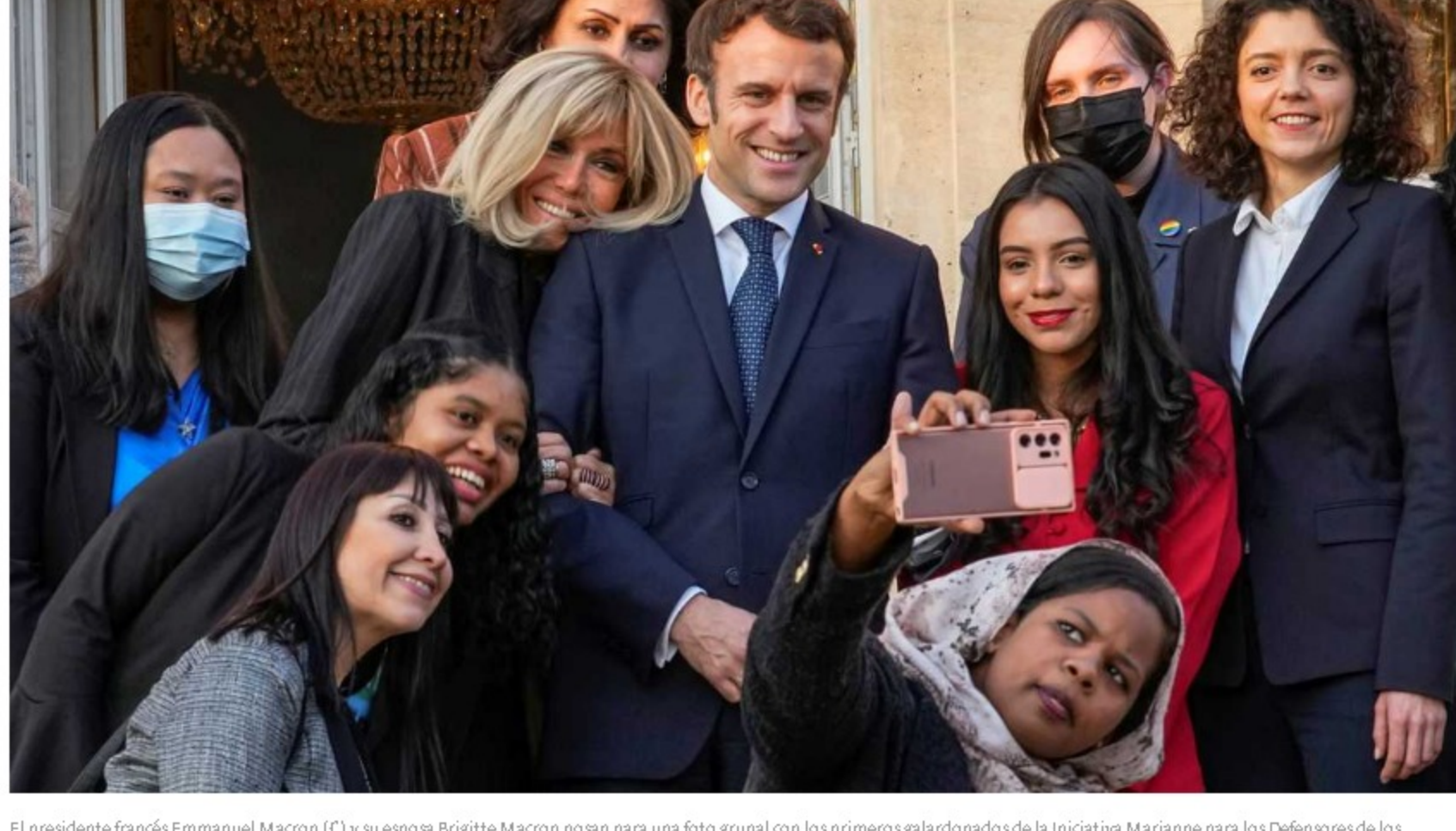
El presidente francés Emmanuel Macron (C) y su esposa Brigitte Macron posan para una foto grupal con los primeros galardonados de la Iniciativa Marianne para los Defensores de los Derechos Humanos luego de una ceremonia de premiación como parte del Día Internacional de la Mujer, en el palacio del Eliseo en París, en marzo.

La joven ambientalista colombiana Yvelis Natalia Morales se reunió con el presidente de Francia, Emmanuel Macron, a quien le expresó sus preocupaciones por la posibilidad de poner en marcha en el país el sistema de fracking para la exploración de petróleo.