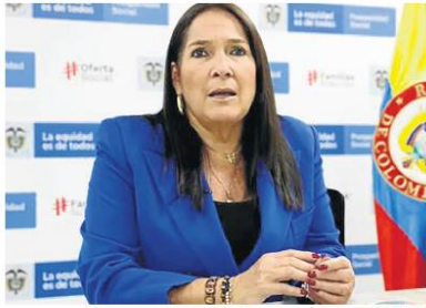
Departamento de Prosperidad Social