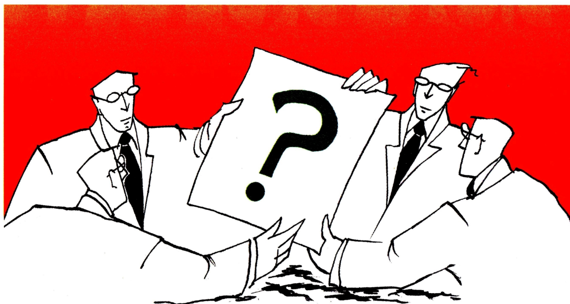
Las comisiones Segunda y Quinta son, principalmente, las responsables de discutir asuntos ambientales.

Buscaba modificar la Ley 99 de 1993 y establecer mecanismos para la transparencia y la gobernanza de las corporaciones autónomas regionales.