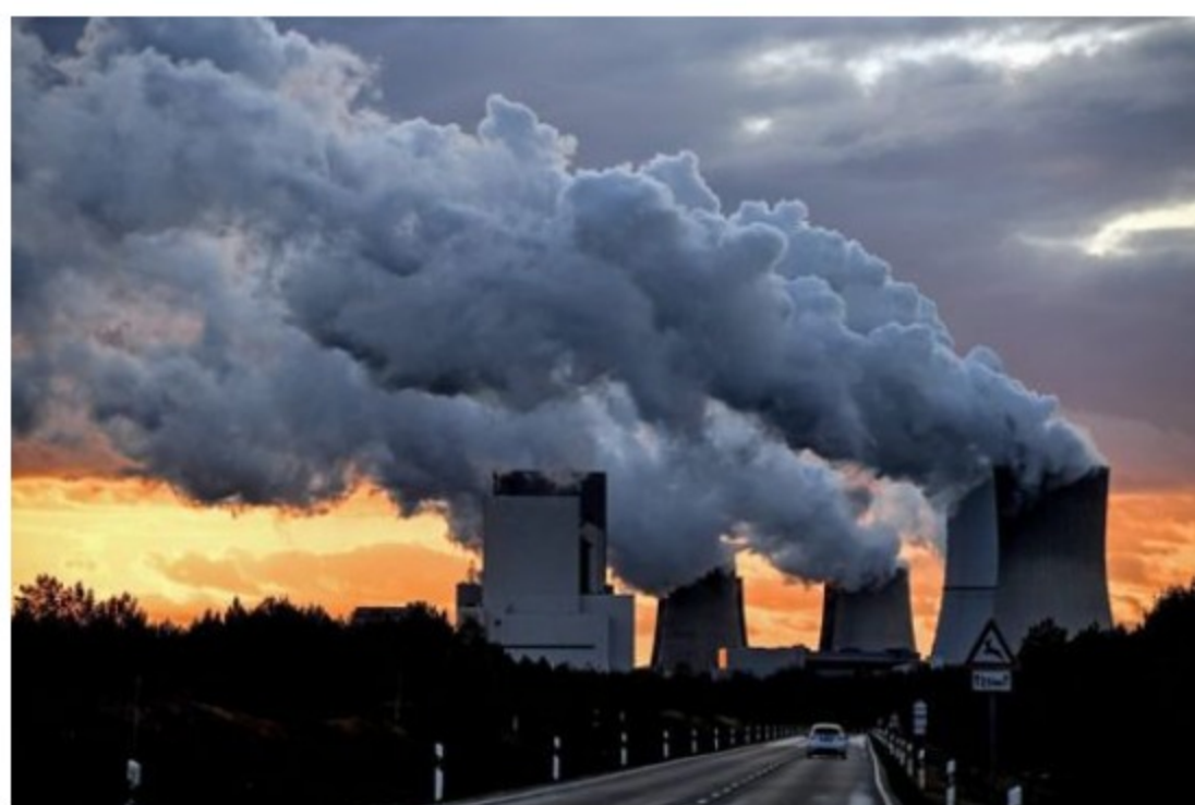
Emisiones de dióxido de carbono.