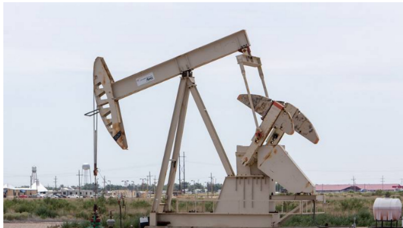
Los precios del crudo superan los US$120 en medio de la guerra de Rusia contra Ucrania. Altos precios del petróleo no significarían una bonanza para Colombia.

Entre las razones que detalla un informe de Bancolombia es que Colombia no es un país petrolero, ¿qué otras razones se exponen y cómo queda parada la nación?