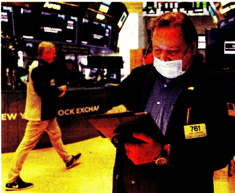
El temor económico y la posibilidad de un bloqueo a Rusia, las claves.

El Brent escaló hasta los US$123 y Wall Street bajó casi un 3%. Pág. 11