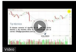
Msci Colcap avanza por segunda semana consecutiva Feb28/22