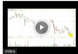
Msci colcap con gran volatilidad en la jornada Feb25/22