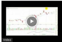
Grupo Argos el título más castigado en Febrero Mar01/22