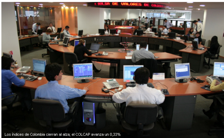
Los índices de Colombia cierran al alza; el COLCAP avanza un 0,33%