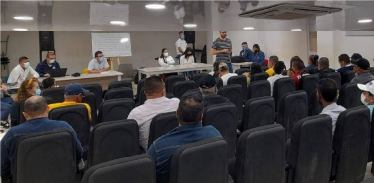
700 contratos suspendidos y 64 pozos apagados por las manifestaciones. La comunidad reclamaba mejores oportunidades laborales

700 contratos suspendidos y 64 pozos apagados por las manifestaciones. La comunidad reclamaba mejores oportunidades laborales