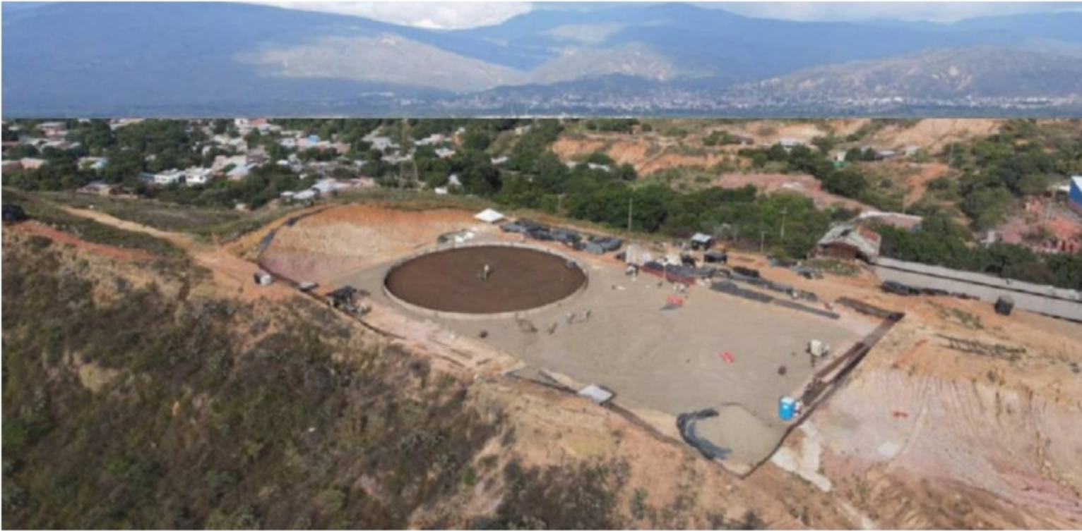
Acueducto metropolitano

La obra permitirá brindar contingencias en el suministro de agua potable