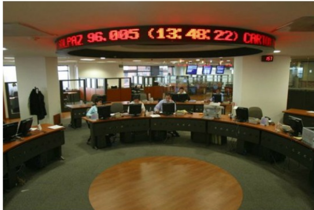
La Bolsa de Valores de Colombia comunicó los resultados de esta emisión de bonos.