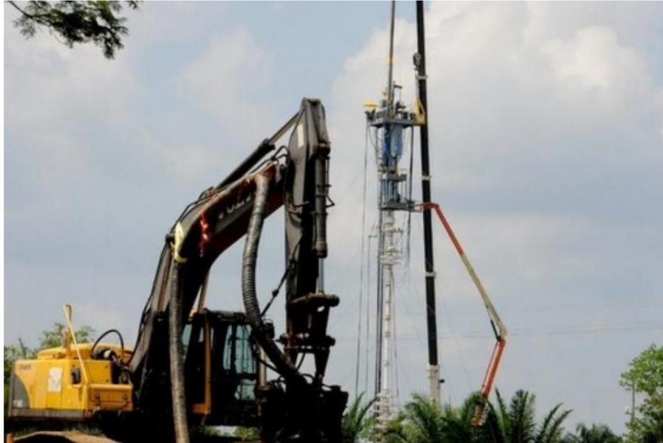
Crédito: Colprensa / EL NUEVO DÍA / Imagen de referencia