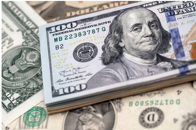
El dólar en Colombia cayó a niveles que no se veían desde octubre del 2021.

El peso colombiano se fortaleció en los últimos días y los niveles actuales lucen para algunos como atractivos para la compra. Las elecciones aún son un riesgo