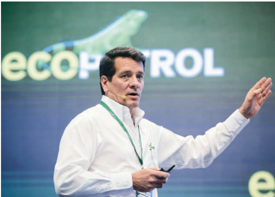
Felipe Bayón, presidente de Ecopetrol, dijo que los ingresos de la compañía cerraron 2021 en US$91,7 billones y crecieron 83,4% con respecto a los registrados el año pasado.