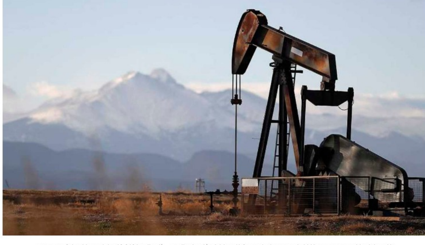
En enero, Colombia produjo 739.848 barriles día, una disminución del 0,75 % frente al mismo mes de 2021.