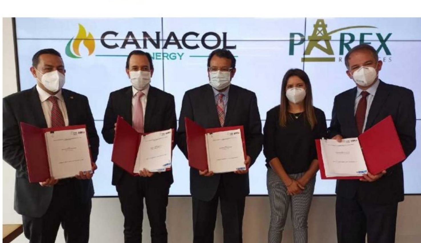
Desde agosto de 2018, se han firmado 69 contratos de exploración y producción en Colombia.

Pero este camino se comenzó a abonar desde agosto de 2018 y son cuatro los frentes en los que ha estado trabajando el Ministerio de Minas y Energía para lograr que la producción de petróleo en Colombia comience a levantar cabeza.