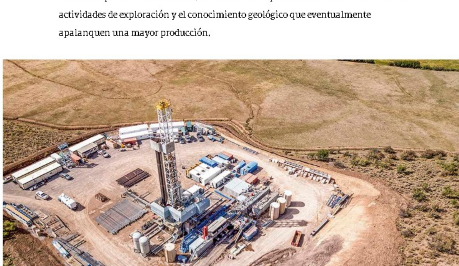
Se espera iniciar la perforación de pozos con fracking en el 2023.

En este propósito también es clave el conocimiento del subsuelo para identificar nuevas áreas prospectivas; por ello, desde el Ministerio de Minas y Energía se han invertido aproximadamente 300.000 millones de pesos con el fin de incentivar las actividades de exploración y el conocimiento geológico que eventualmente apalanquen una mayor producción .