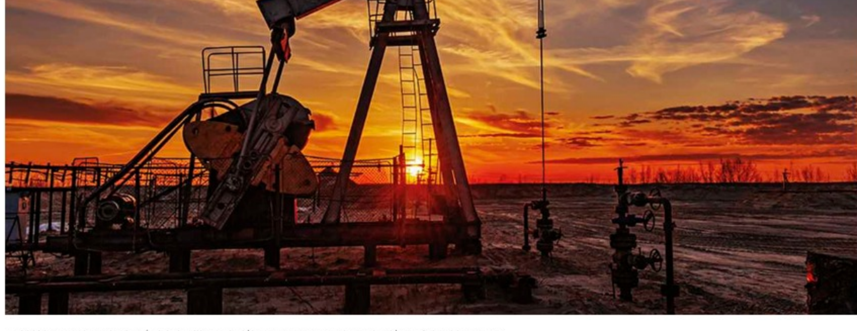
En 2022 las petroleras destinarán 3.270 millones de dólares para aumentar la producción en Colombia. - Foto:

Mientras el precio del petróleo Brent, referencia para las cuentas fiscales de Colombia, sube como espuma cada día tras la invasión de Rusia a Ucrania, la producción no se recupera; incluso, inició el 2022 con nuevas caídas, alejando al país de beneficiarse de esta "minibonanza" petrolera que no se veía desde 2014.