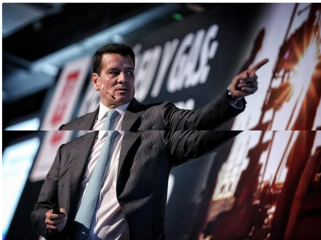
Felipe Bayón, presidente de Ecopetrol