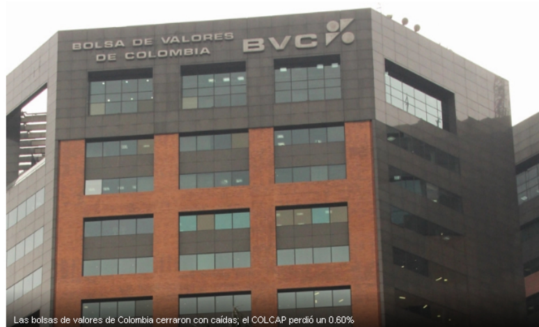
Las bolsas de valores de Colombia cerraron con caídas; el COLCAP perdió un 0.60%

Investing.com – El mercado de Colombia cerró con descensos este miércoles; los retrocesos de los sectores finanzas , COL Inversionist , y servicios públicos empujaron a los índices a la baja.